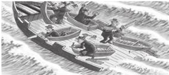
自利,只会一起沉没